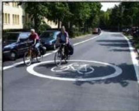
Bodenmarkierung mit Symbol Fahrrad